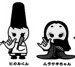
ピカルくん ムラサキちゃん