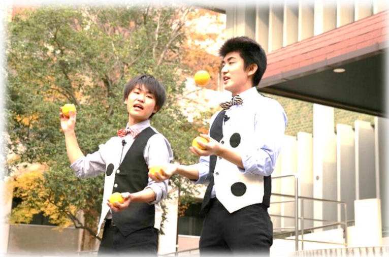
京都大道芸倶楽部